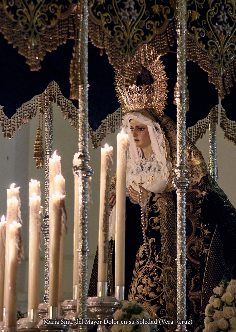
María Sma. del Mayor Dolor en su Soledad (Vera+Cruz)