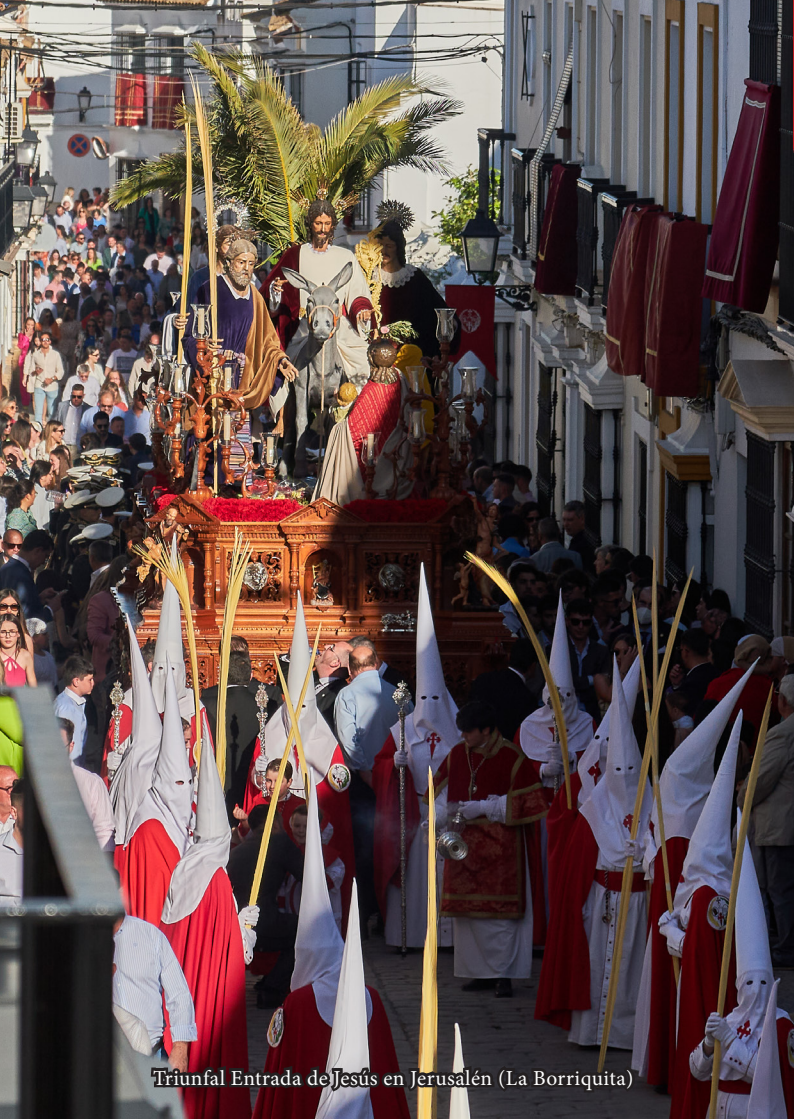
Triunfal Entrada de Jesús en Jerusalén (La Borriquita)