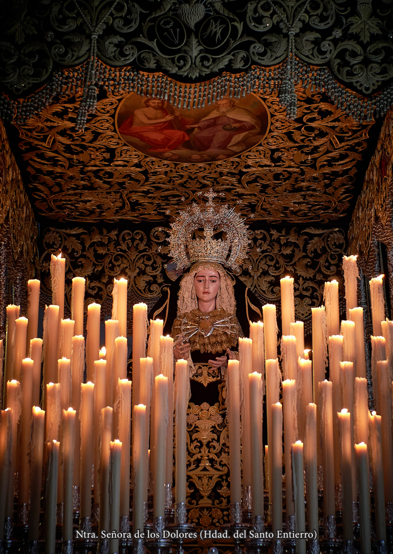
Ntra. Señora de los Dolores (Hdad. del Santo Entierro)