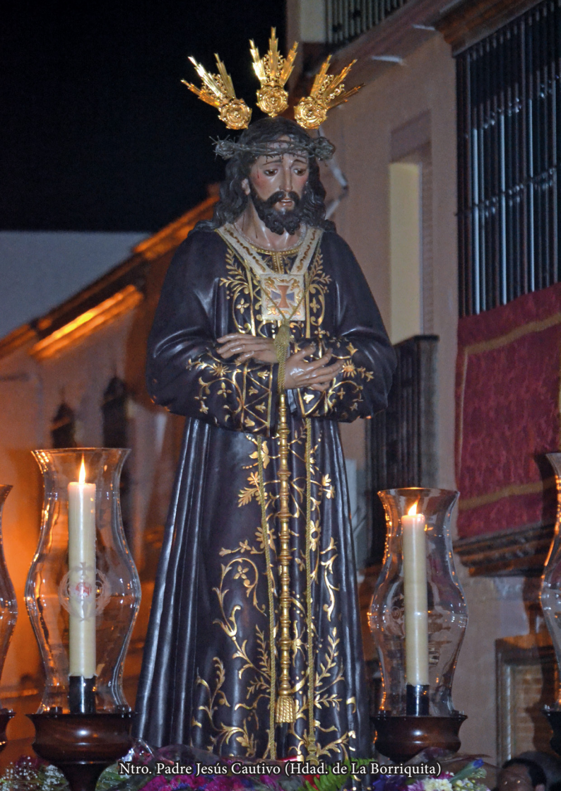
Ntro. Padre Jesús Cautivo (Hdad. de La Borriquita)