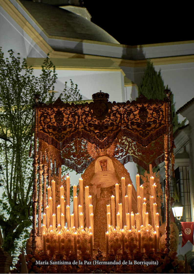
María Santísima de la Paz (Hermandad de la Borriquita)