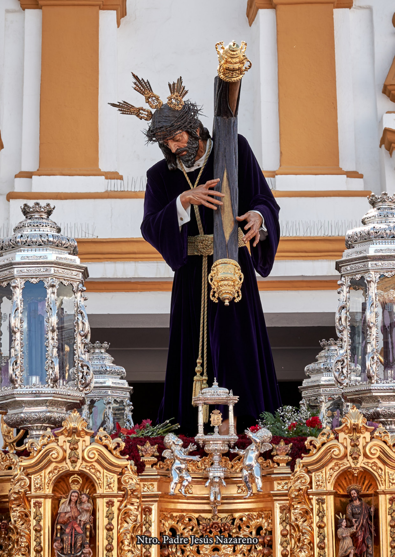
Ntro. Padre Jesús Nazareno