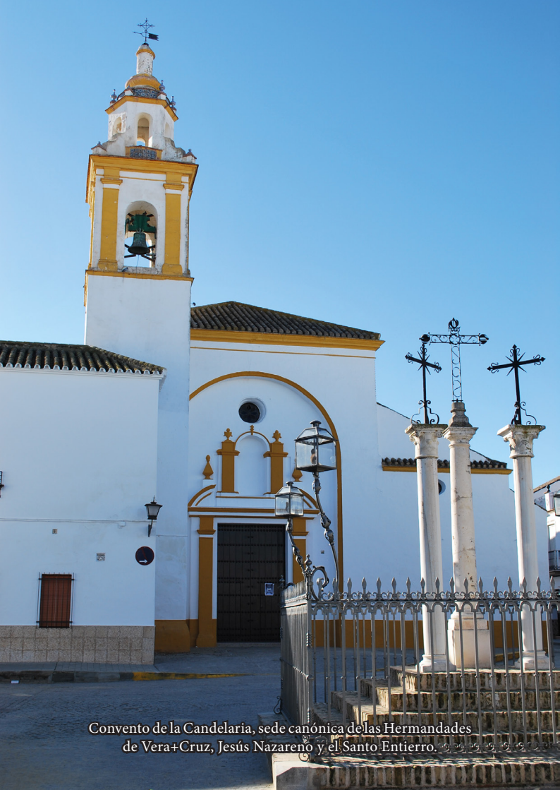
Convento de la Candelaria, sede canónica de las Hermandades de Vera+Cruz, Jesús Nazareno y el Santo Entierro.