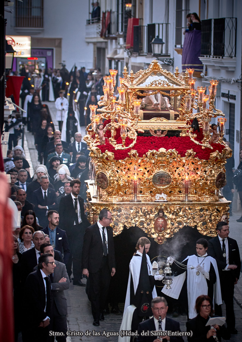
Stmo. Cristo de las Aguas (Hdad. del Santo Entierro)