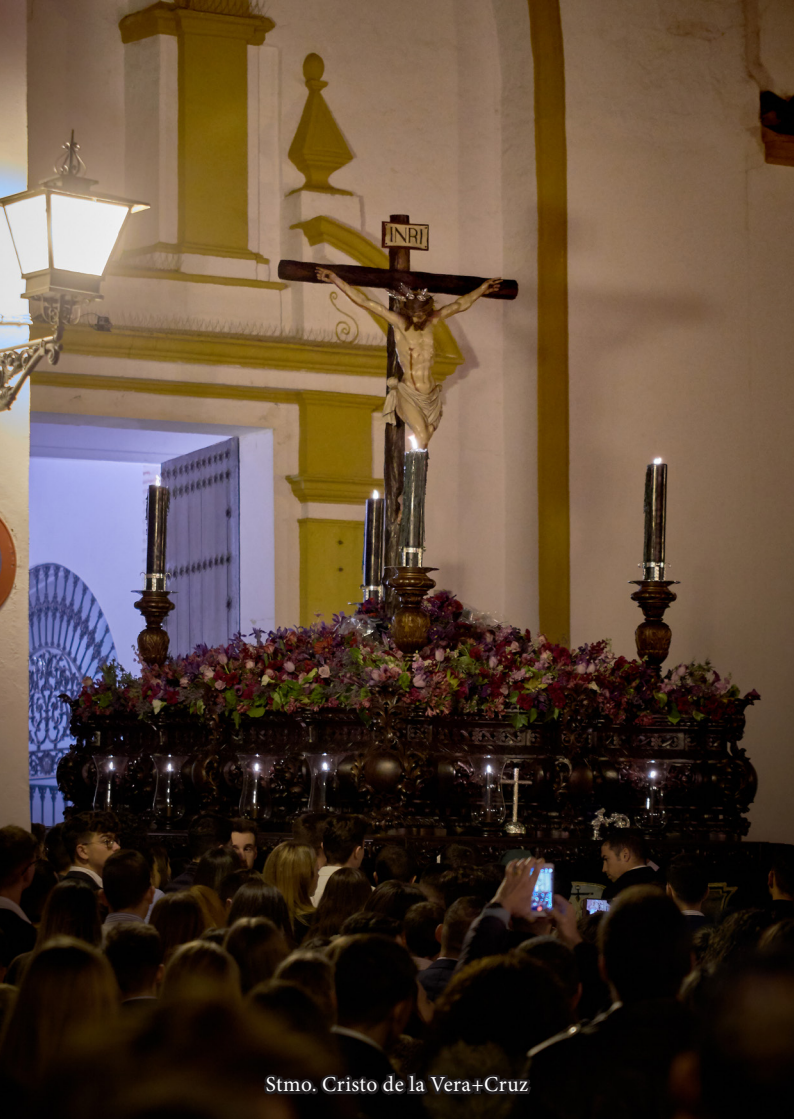
Stmo. Cristo de la Vera+Cruz