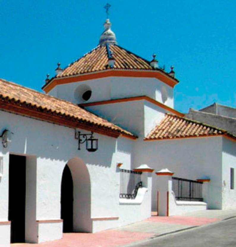
Ermita de San José, donde cada año se realiza la bendición de las palmas el Domingo de Ramos.