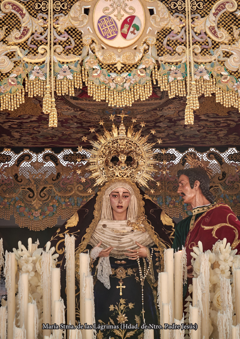
María Stma. de las Lágrimas (Hdad. de Ntro. Padre Jesús)