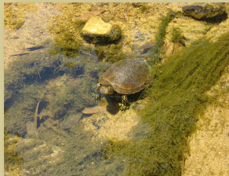
Galapago leproso en la Rivera de Cala