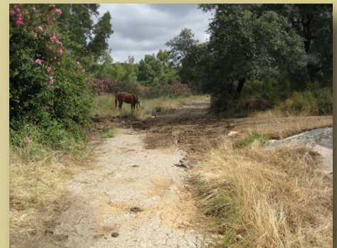
Paraje de La Rivera de Cala